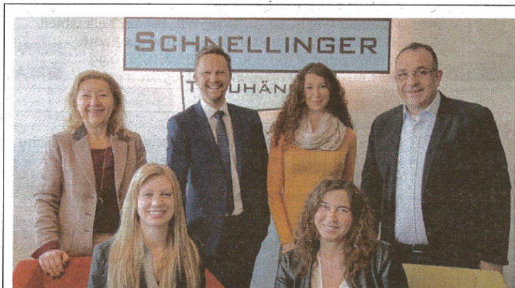
Bei Schnellinger Immobilien stehen Ihnen die Mitarbeiter mit Erfahrung und Kompetenz zur Seite.